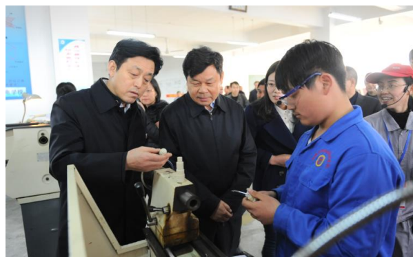
图 4 教育部副部长杜占元及省市领导莅临学校督察开学工作（2016 年）

2015 年 6 月国务院教育督导组国家督学、教育部职业教育与成人教育司领导莅临学校，督导专家组对学校的教育教学成果给予了充分的肯定，并希望我校能进一步提升办学规模，为合肥市乃至安徽省职业教育增光添彩。