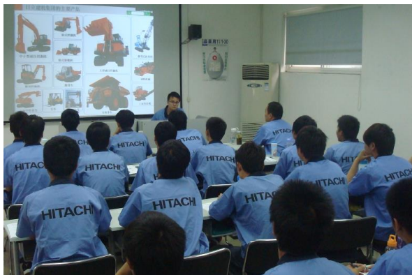
图 10 学生在实习企业学习