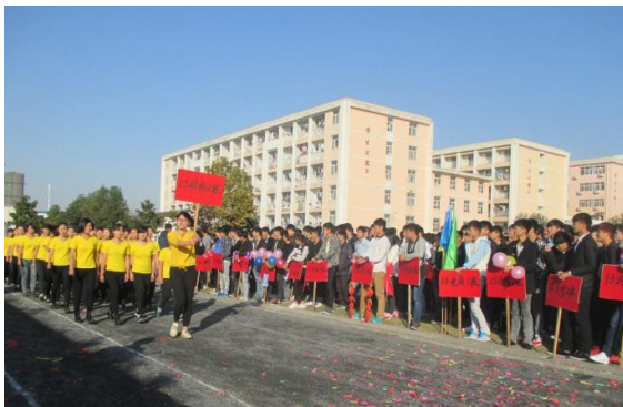
图 8 校园运动会