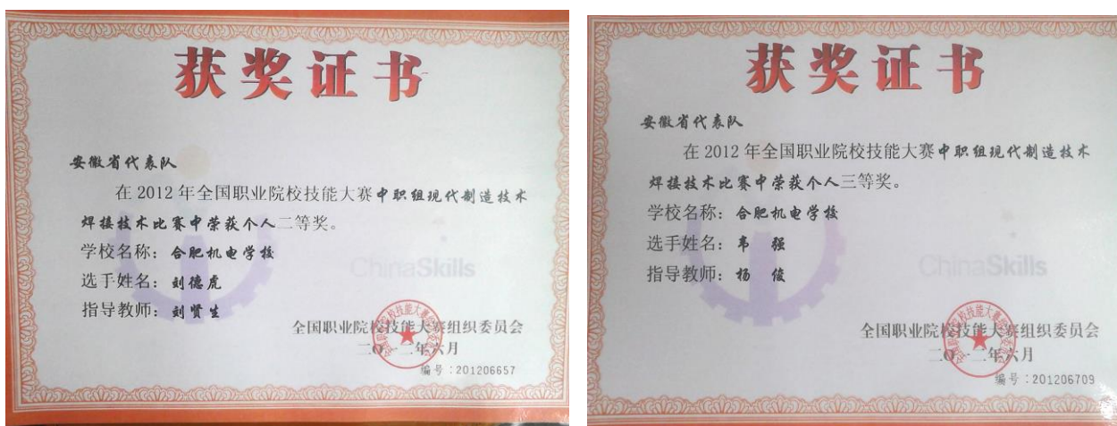
图 2 优秀学生国赛获奖证书

2014 年，刘德虎同学以优异的成绩拿到了全国竞赛的“入场券”，成为安徽省唯一进入全国大赛的选手。2015 年，刘德虎获得国际焊接技师报考资格，取得国际焊接技师（IWS）资质。如今，刘德虎同学和韦强同学都已走上各自的工作岗位。两人月薪均过万元。