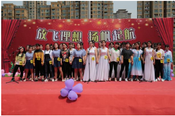
图 6 学校文艺汇演图