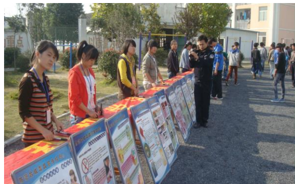
图 9 安全教育宣传

学校组织学生参加第十二届“文明风采”活动，获省级三等奖 11 项，市级一等奖 3 项、二等奖 9 项、三等奖 36 项；第十三届“文明风采”活动，获省级三等奖 2 项，市级一等奖 3 项、二等奖 15 项、三等奖 33 项。