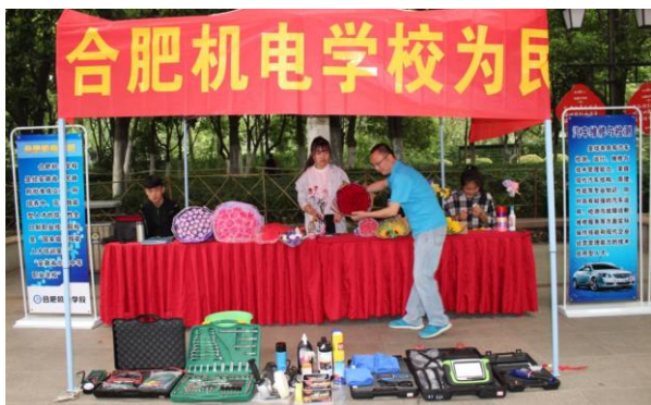
图 11 学校参加职业教育活动周