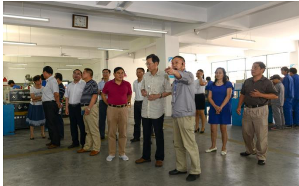
图 3 国务院教育督导组莅临学校督导、调研职业教育工作（2015 年）

2015 年 6 月国务院教育督导组国家督学、教育部职业教育与成人教育司领导莅临学校，督导专家组对学校的教育教学成果给予了充分的肯定，并希望我校能进一步提升办学规模，为合肥市乃至安徽省职业教育增光添彩。