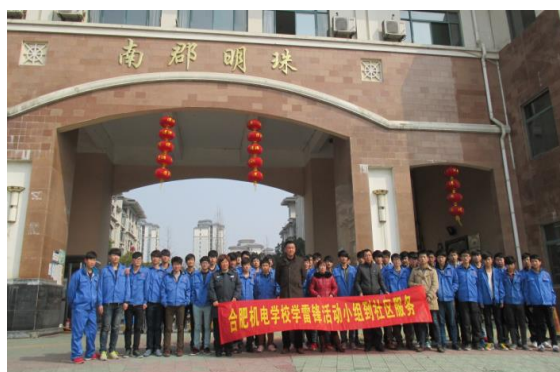
图 12 社团参加社区服务