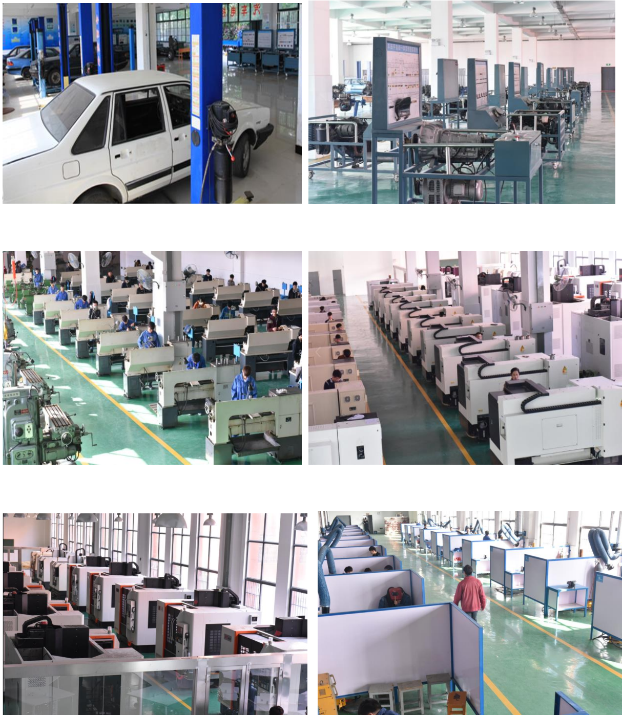
图1 学校实训设备设施展示（部分专业）

学校校园局域网覆盖教学、实训、计算机网络中心和所有办公室，实现了信息资源共享。拥有配备 380 台液晶电脑的网络计算机中心、数控仿